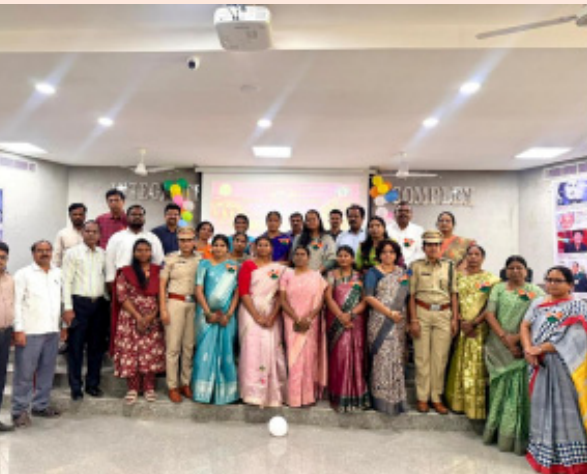
వివిధ శాఖల్లో ప్రతిభ కనబరిచిన మహిళా ఉద్యోగులను ఈ సందర్భంగా సన్మానించారు. సమాజ నిర్మాణంలో మహిళల పాత్ర కీలకమని కొనియాడారు. కార్యక్రమంలో జిల్లా అధికారులు, ప్రజాప్రతినిధులు, మహిళలు తదితరులు పాల్గొన్నారు.